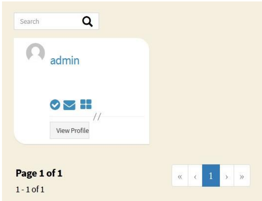
Gambar 1. Tampilan Admin

Implementasi antarmuka dari perangkat lunak dilakukan berdasarkan rancangan yang telah dilakukan. Implementasi ditampilkan dari halaman website yang digunakan sebagai alat dan bahan penelitian yang telah dirincikan.